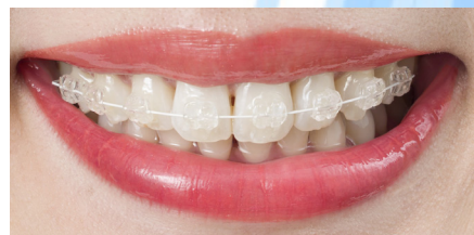
使用ブラケット：クリスタプレース 3