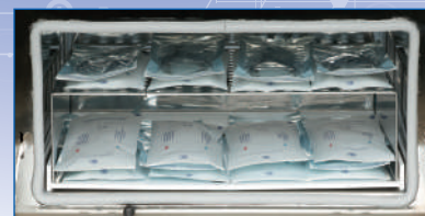
滅菌パック使用時 (イメージ)