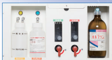
ホルマリン液自動注入装置