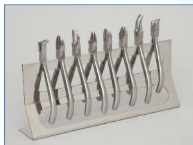
矯正用プライヤー棚 (幅250mm高さ101mm)