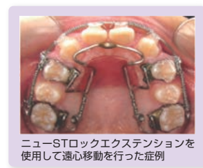
ニューSTロックエクステンションを使用して遠心移動を行った症例