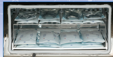
滅菌パック使用時 最大88袋