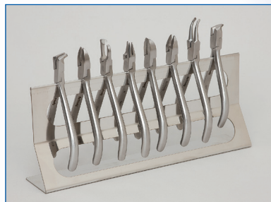
矯正用プライヤー棚 最大28本 棚は最大4本入ります