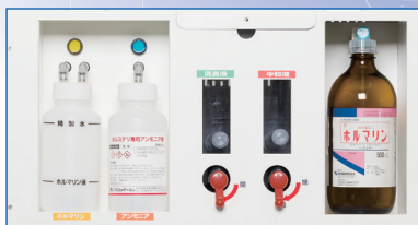
ホルマリン液自動注入装置